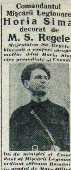
Comandantul Mișcării Legionare Horia Sima, decorat de M. S. Regele

Avocații vor pleda în robă Consiliul Baroului Ilfov a hotărât să înceapă d-l 9 Ianuarie 1941 să pună în vigoare dispozițiunile art. 292 din legea de organizare a Corpului, care prevede că avocații sunt obligați să poarte roba când pledează în fața instanțelor Curții de Casație și a Curților de Apel.